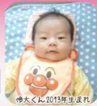
伸大くん2013年生まれ