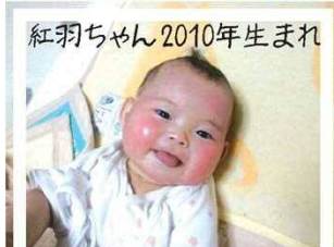
紅羽ちゃん2010年生まれ