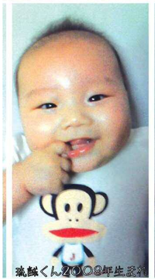
琉球くん2008年生まれ